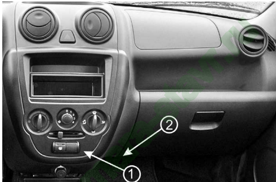
Рис.1 Вид на панель приборов.

Установка БК производится вместо заглушки панели приборов.