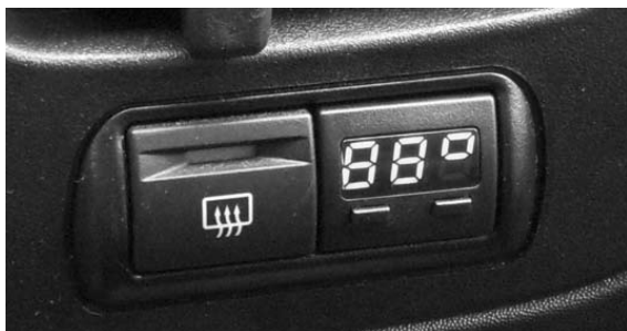
Рис.3 Вид установленного БК